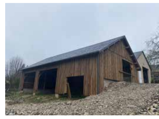
construction du hangar qui abritera la chaufferie et de garage pour le matériel et le tracteur